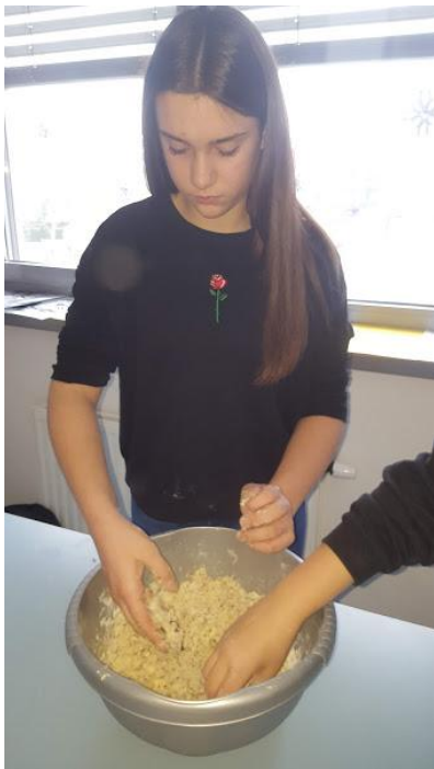
Slika 15: priprava testa