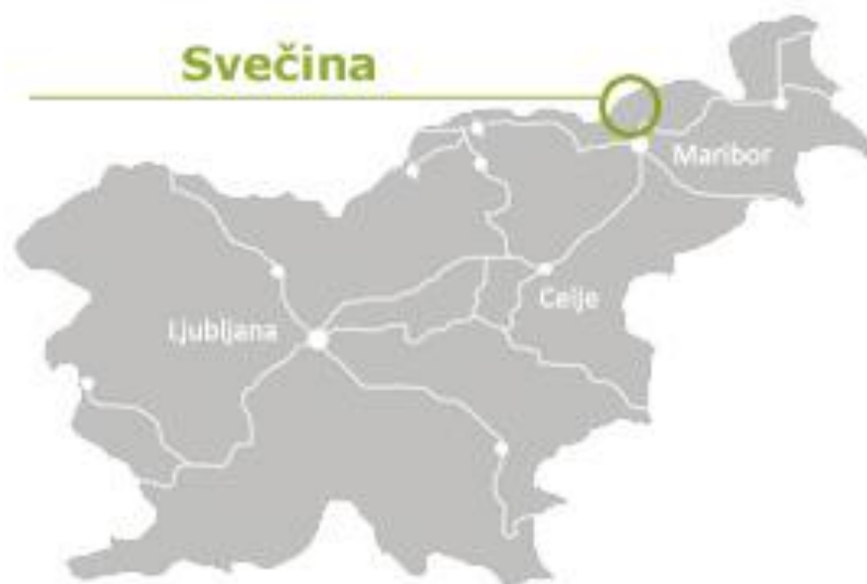
Slika 3: lega Svečine v Sloveniji