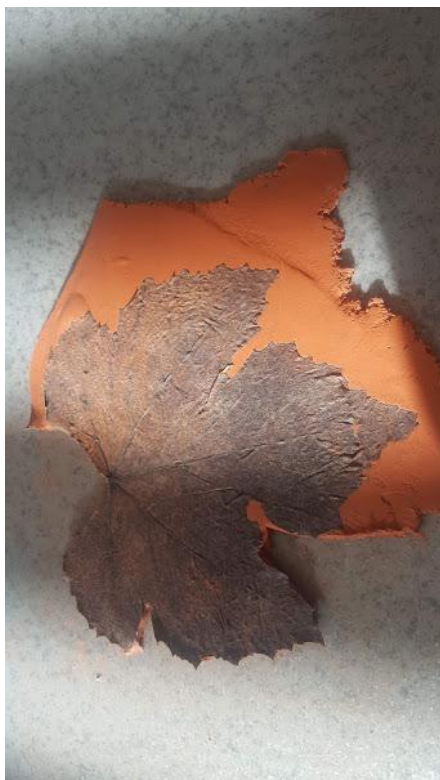
Slika 9: priprava skodelice