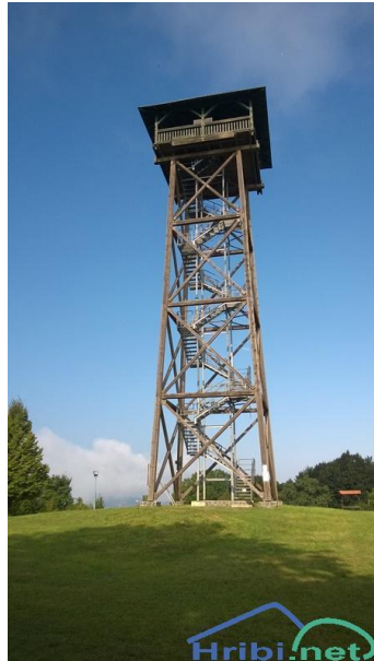
Slika 4: Plački stolp