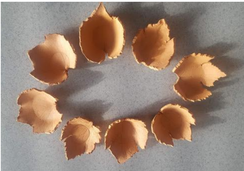
Slika 13: pečene skodelice