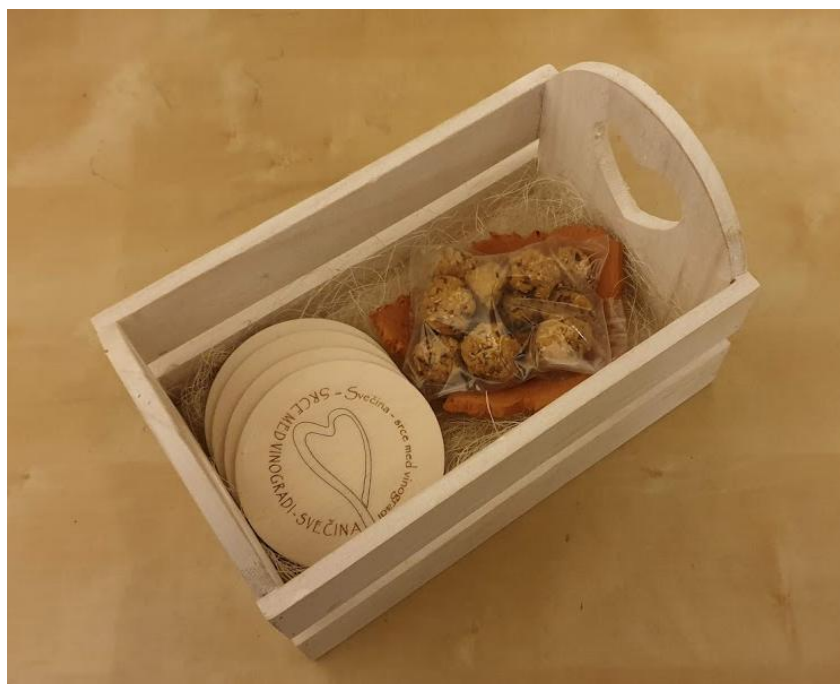
Slika 19: mala gajbica