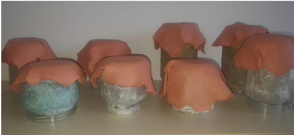
Slika 12: sušenje skodelic