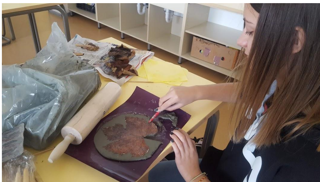
Slika 11: izdelava skodelice