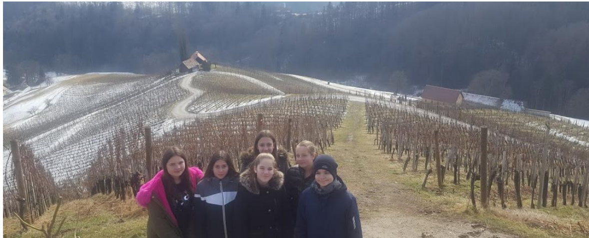
Slika 1: Srce med vinogradi