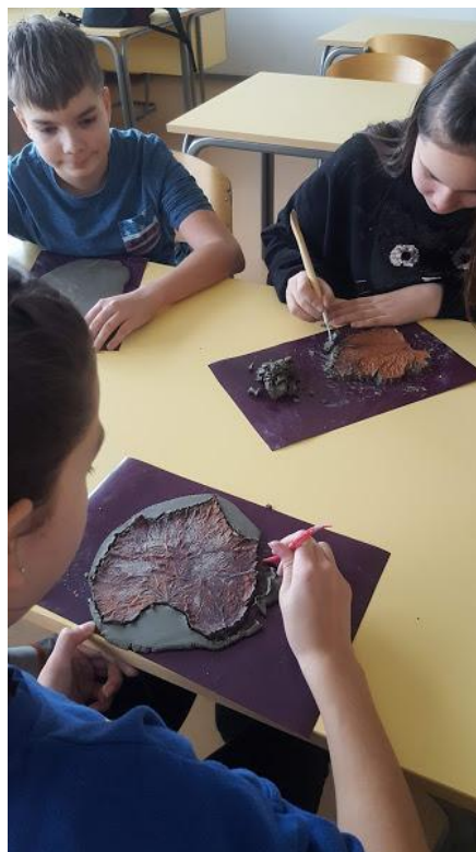
Slika 10: izdelava skodelice