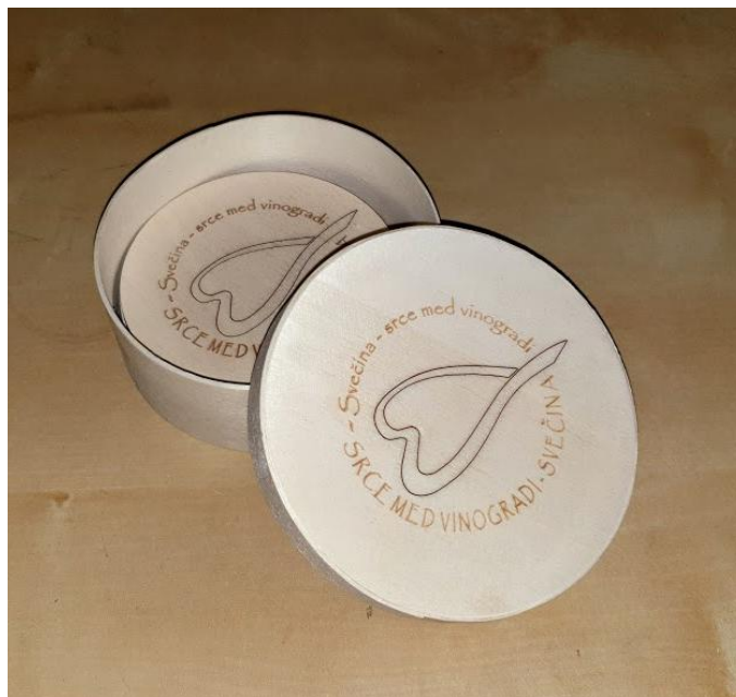
Slika 18: podstavki v darilni škatlici