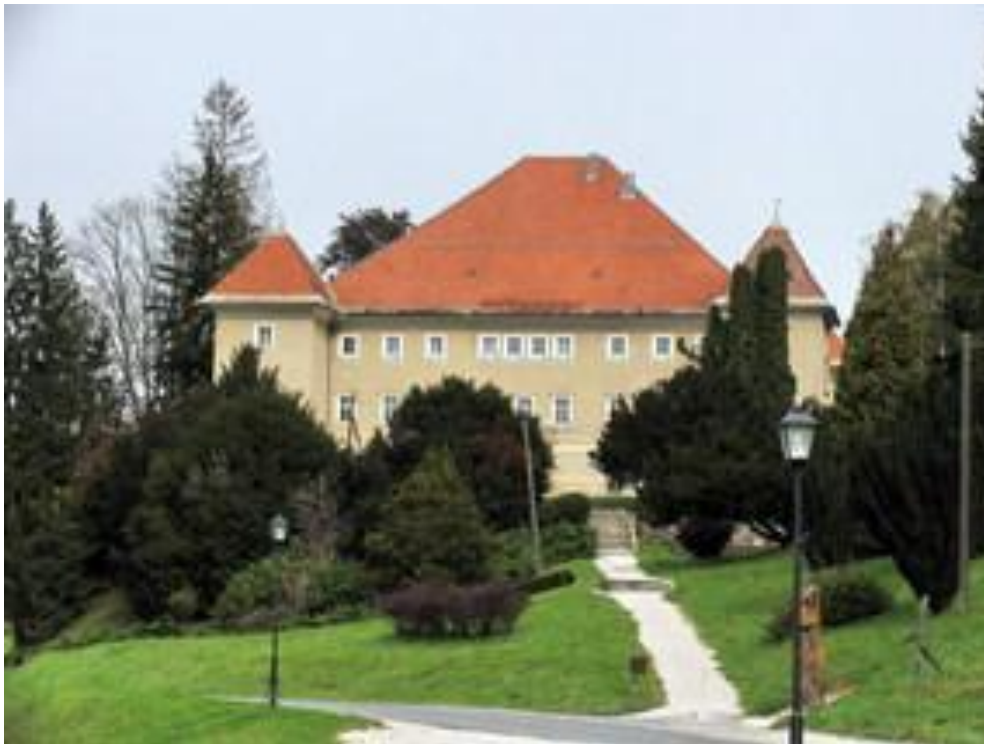
Slika 6: Svečinski grad

Prvotni grad, ki se omenja v listini iz 12. stoletja je bil v lasti Sekavskega samostana iz Judenburga. Stal je na bližnjem griču severno od današnjega dvora. Leta 1532 so Turki grad požgali. V bližini grajskih ruševin so postavili sedanji dvor. Iz zapisa nad vhodom lahko sklepamo, da so bili temelji postavljeni leta 1629. Dvor je večkrat zamenjal lastnike, ki so ga preurejali. Leta 1935 je postal izobraževalna ustanova za šolanje gospodinj in kmetovalcev. Po drugi svetovni vojni pa je bila v njem kmetijska gospodinjstva ter sadjarsko-vinogradniška šola. Stavba je bila kasneje nekaj let opuščena, nato pa je država grad prepisala na občino. Turistično društvo Svečina je v njem uredilo stalno razstavo z naslovom Zakladi s podstrešja. Zanimiva in zajetna zbirka privablja ljubitelje starin, saj so na ogled staro pohištvo, porcelan, stekleni izdelki, tehnični predmeti, glasbeni inštrumenti, knjige... Na ogled je tudi zbirka Vinske kraljice, saj v Svečini že od leta 1987 vsako leto okronajo svečinsko vinsko kraljico. (Čerič, 2010)