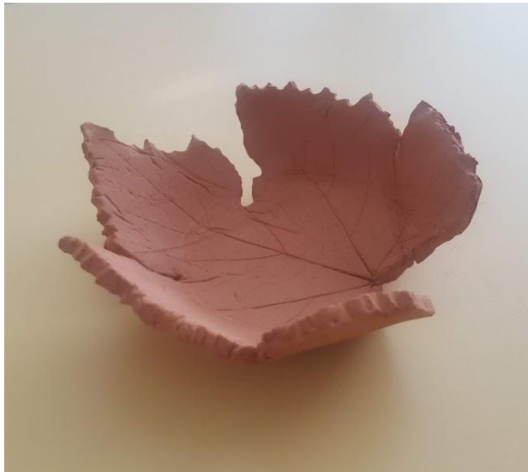
Slika 14: skodelica v obliki trtinega lista