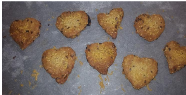
Slika 16: pečeni keksi