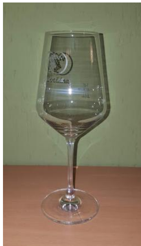
Slika 17: kozarec

Logična povezava med vinom in podstavkom je seveda vinski kozarec. Zato smo se odločili, da v skupino turističnih spominkov vključimo tudi kozarec z gravirano podobo srca med vinogradi. Izdelavo smo zaupali podjetju Piko's printshop d.o.o.