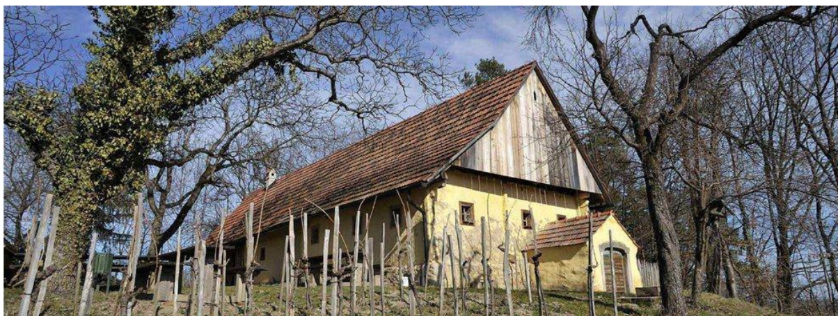
Slika 5: vinogradniški muzej Kebl