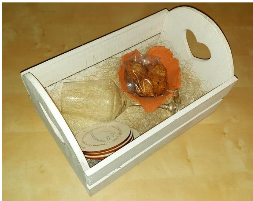
Slika 20: velika gajbica