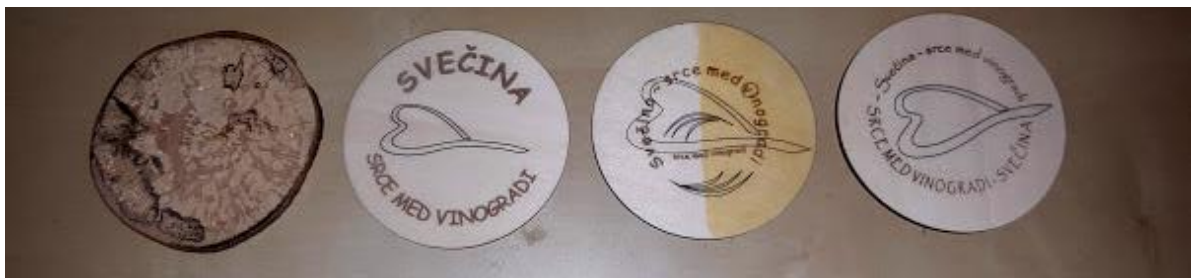
Slika 8: podstavki v različnih fazah razvoja